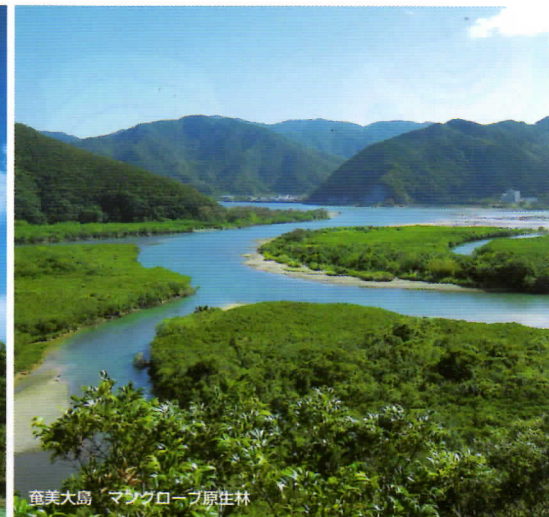
奄美大島 マングローブ原生林